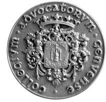
Consiglio dell'Ordine degli Avvocati di Genova

con il patrocinio del Consiglio Nazionale Forense